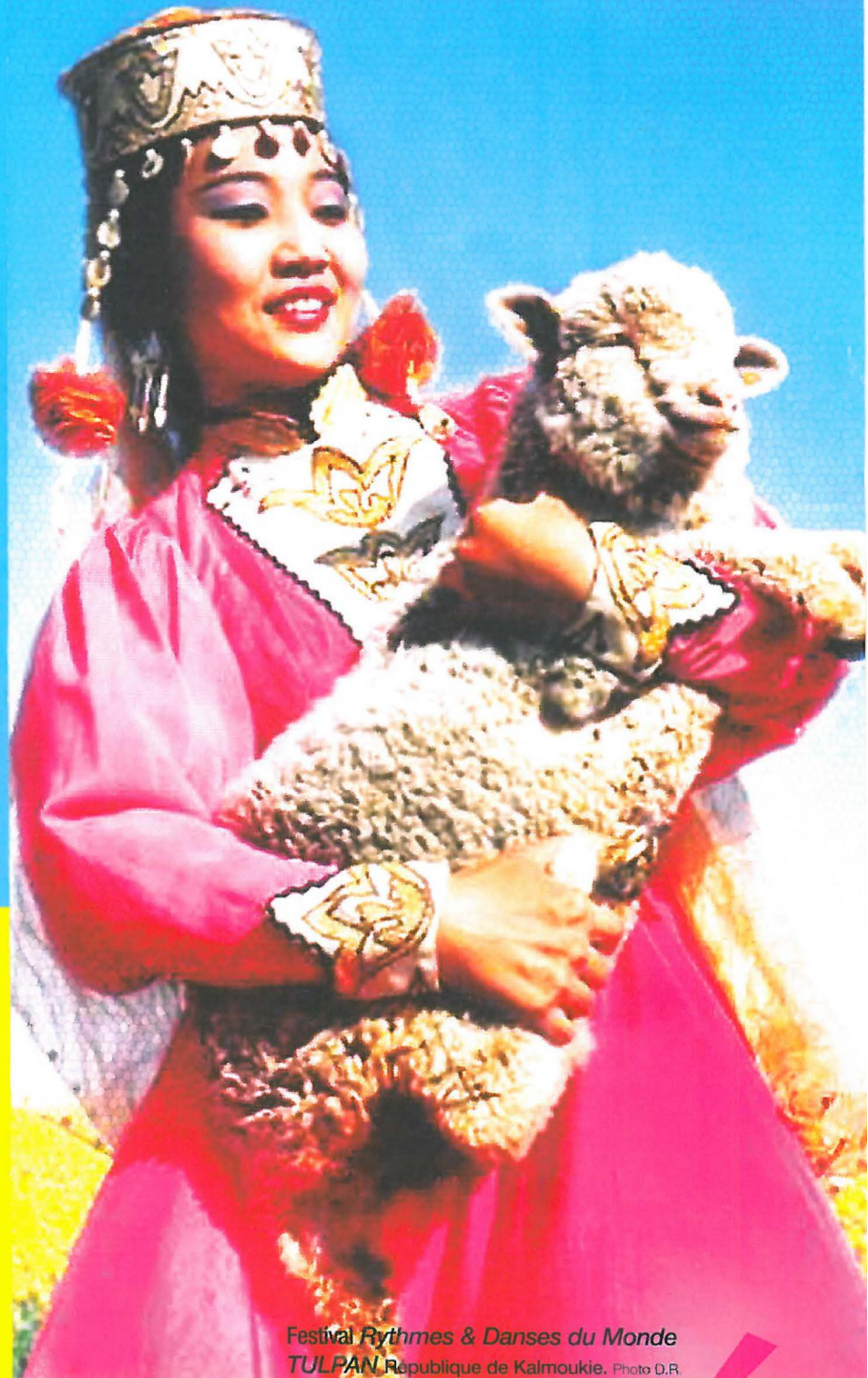
Festival Rythmes & Danses du Monde TULPAN République de Kalmoukie.