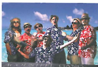
Acousteel Gang.

Mercredi 22 juillet 19h. Acousteel Gang « Melocoton Tour ! » Bidons en bandoulière, les 8 compères revisitent et dépoussièrent en big band des musiques d'ailleurs et quelques grands standards disco, funk, ska... Place des Carmes - gratuit