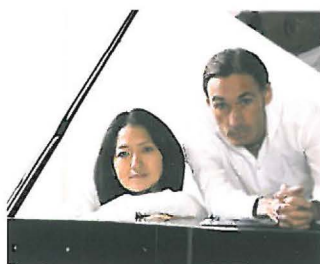
Duo Ykeda.

Mercredi 8 juillet 20h 30. Concert de piano classique avec le Duo Ykeda. Maurice Ravel, Johannes Brahms, Anton Dvorak, Bedrich Smetana. Dans le cadre du Festival Entre 2 Mers ( www.festival-entre2mers.com ) Scène des Carmes - Entrée 15 euros. Billetterie : Office de tourisme de Langon 05 56 63 68 00.