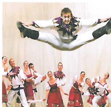
Les Aurores de Printemps, Russie.

20h : Festival International Danses et Rythmes du Monde Ensemble folklorique national OTHELLO Chypre du nord Ensemble folklorique national TULPAN République de Kalmoukie Ensemble folklorique Les AURORES de PRINTEMPS Russie