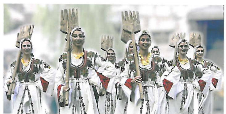
OTHELLO, Chypre.

Mercredi 29 juillet 19h. Bal sous les oliviers. Place des Carmes - gratuit