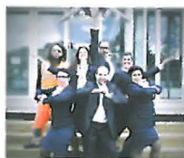
Destination Art'Line.

Samedi 11 juillet 19h. Blues sous les oliviers. Place des Carmes - gratuit.