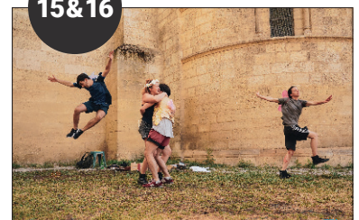
L'AGENDA DE L'ÉTÉ