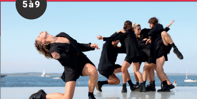
LES ESTIVALES DES QAIS DE GARONNE