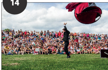
LA RENTRÉE CULTURELLE