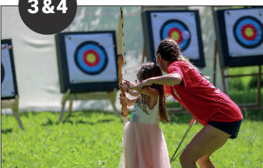
QUOI DE NEUF CET ÉTÉ ?