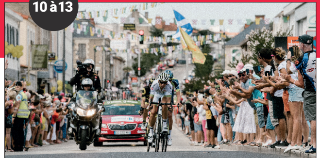
LE TOUR DE FRANCE