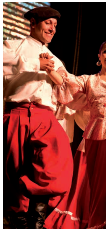
Le groupe Chilien Tupa Marka.

L'idée de base reste la même : un air de vacances au cœur de la ville. Une belle plage de sable avec des transats, des seaux et des pelles pour faire des châteaux de sable, et pour les plus actifs, une multitude de propositions ludiques et sportives montées en partenariat avec les associations langonnaises. Citons en vrac les tables de ping-pong, des ateliers de maquillage, de peinture ou de fabrication de bonbons, une belle piste de bowling en bois spécialement construite par le menuisier des ateliers municipaux, de la magie, les structures gonflables de Youpi Parc, un terrain de volley, des tournois avec le Langon Football Club, des jeux d'équilibre, des chasses aux trésors, des mouvements