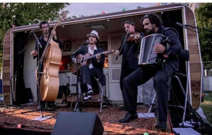
La caravane des Romano Dandies le 30 juillet Sous les Oliviers .