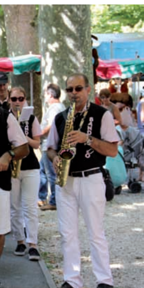
Animations de la Foire aux vins et aux fromages.

Le vendredi 26 août de 19h à 2h (sans exposants), le samedi 27 de 10h à 2h 30 et le dimanche 28 de 10h à 20h. Tarif : 2 euros, comprenant un verre pour déguster.