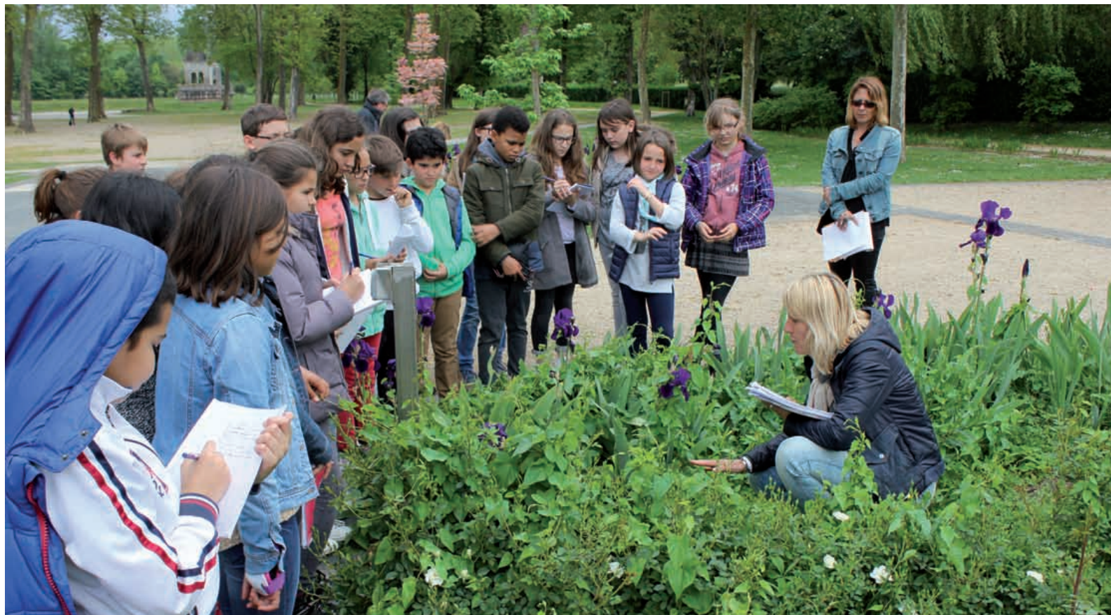
Les CM2 en reportage au parc des Vergers.