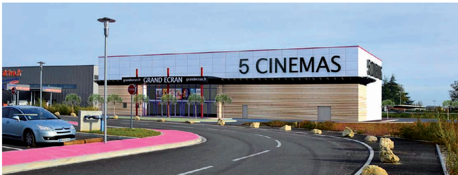
Le projet de cinéma in-situ.