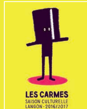
Illustr. A. Lacroix - O. Poppe