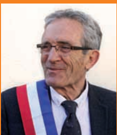
Philippe Plagnol Maire de Langon, Président de la Communauté de communes du Sud-Gironde.

Pour l'instant, place à l'été ! La seconde partie de ce magazine - côté face - est consacrée à tous les rendez-vous qui vous seront proposés jusqu'en septembre. Certains sont déjà bien ancrés dans nos traditions. D'autres, comme Sous les Oliviers ou Langon Plage , sont plus nouveaux. Ils contribuent eux aussi au dynamisme de notre ville et à la qualité de notre vivre ensemble. Je vous y attends !