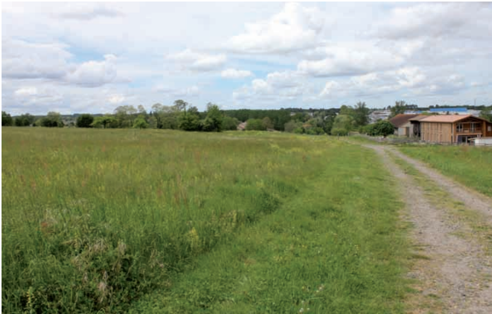
Le PLU privilégiera l'urbanisation des zones disponibles à proximité du centre-ville. Ici Péran.