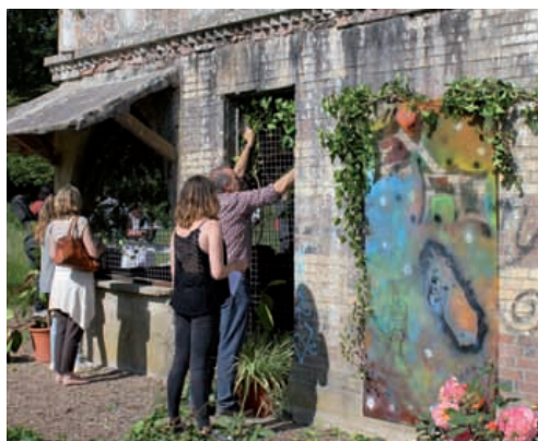
Les lycéens ont fleuri la Tour Mauresque.

Les classes de seconde et première option arts plastiques du lycée Jean Moulin ont investi le parc des Vergers, le 21 mai dernier, pour transformer la Tour Mauresque en Tour romantique . Leur installation éphémère est le fruit d'un trimestre de travail avec des étudiants de l'école d'architecture et de paysage de Bordeaux. Dix projets avaient été imaginés, sans contrainte technique ou financière, comme l'installation d'un dôme en verre ou le creusement de douves, mais c'est finalement l'embellissement de la tour qui avait été retenu, avec végétalisation des façades et installation de tags sur plexiglass pour ne pas nuire aux travaux de nettoyage et de mise en sécurité menés en mai par l'association Adichats sur commande de la Ville.