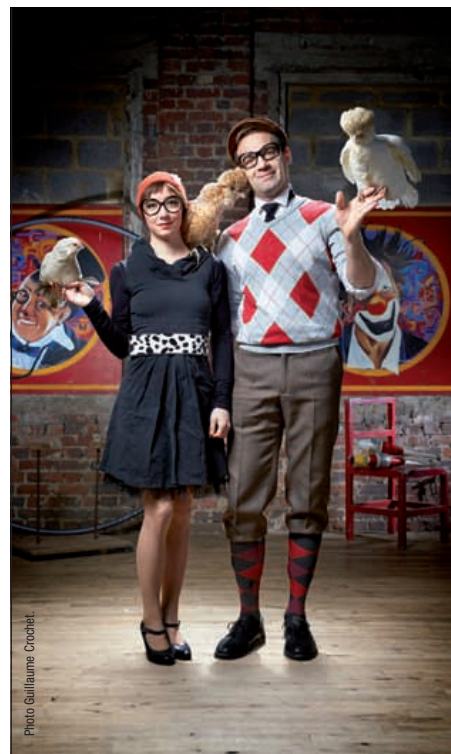
La Cie des plumés ouvre la saison 2016/2017.