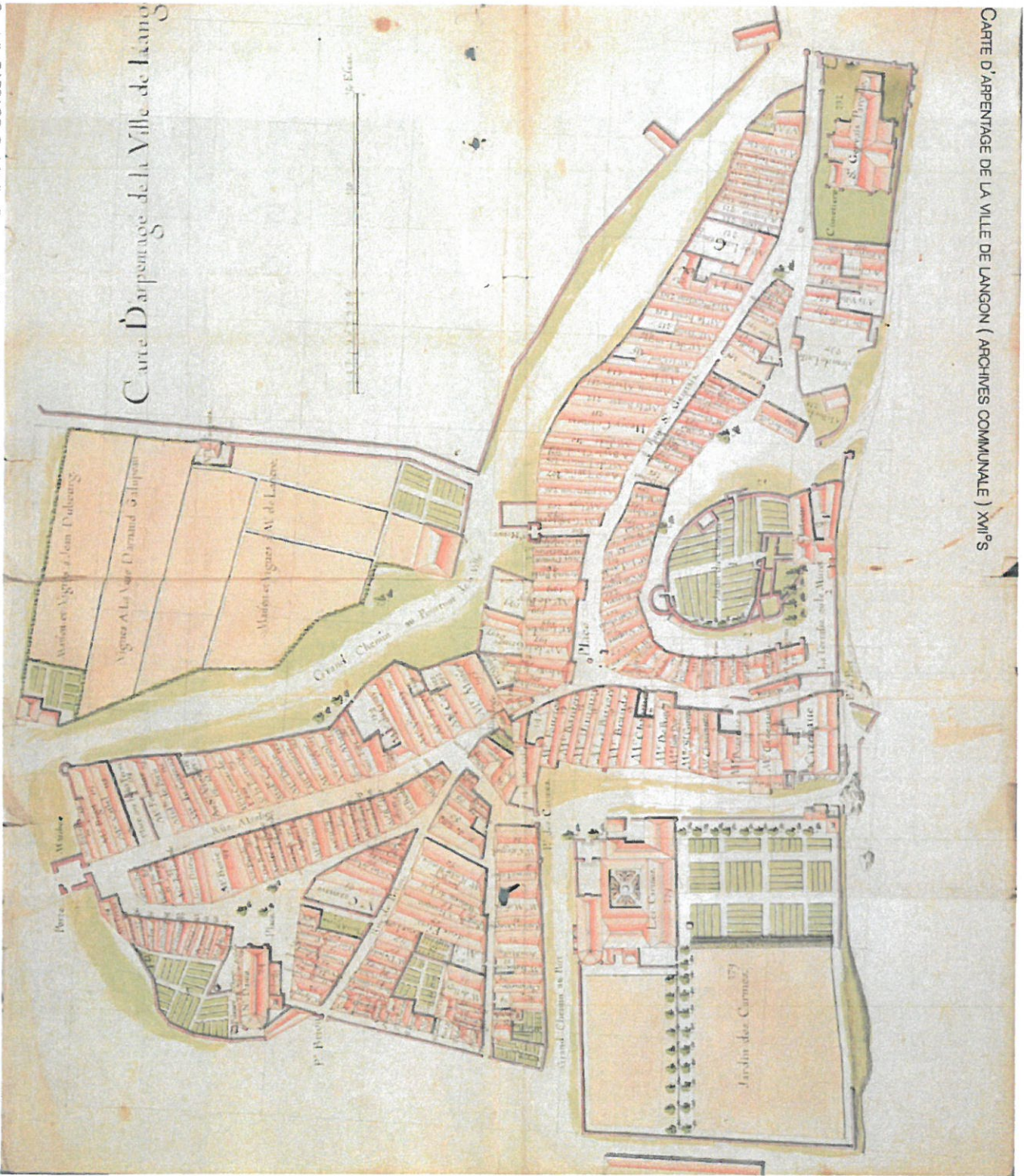
CARTE D'APPARTENANCE DE LA VILLE DE LANGON ( ARCHIVES COMMUNALE ) XVII es