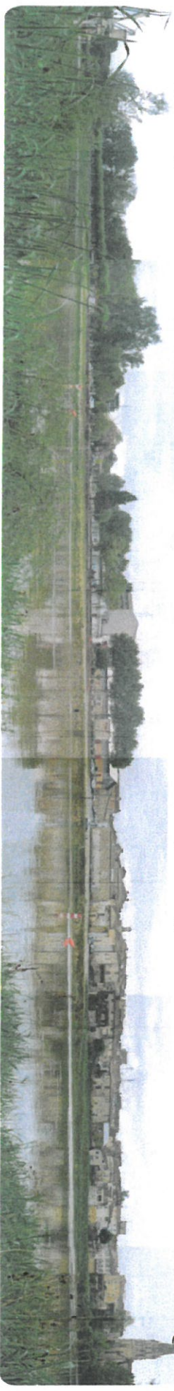
Une situation au creux du méandre

La grue Le parc des verges La promenade de la frégate des Carnes Le creux des remparts La ville en terrasse La grève végétale Le port au bois en balcon sur la Garonne Les quais du port de la mer Les quais du port de la mer Le chemin de halage